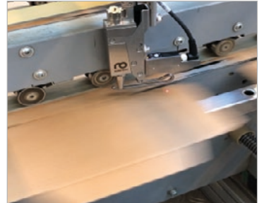
SpeedUp katlama sıvısının katlama çizgisine uygulanması