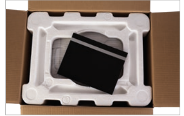
Hassas yerleştirme için doğru boyutlar