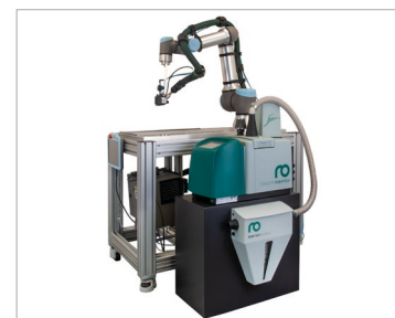
带有喷胶系统、可自动加胶的协作机器人