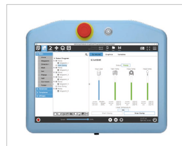
URCap 软件 GlueBot