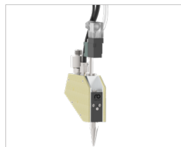
搭载长款喷嘴的喷枪 (295)