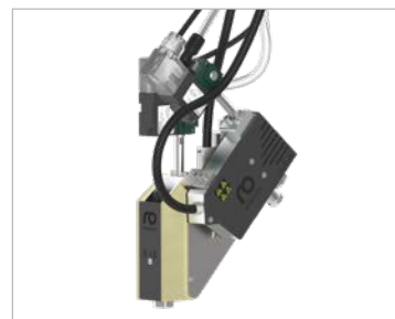
带有外部空气加热器的喷枪