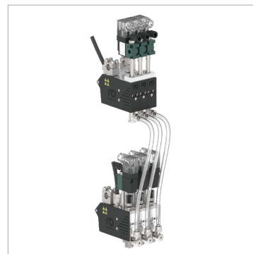
Tête de pulvérisation en version multiple avec réchauffeur d'air décalé