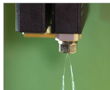
Collaboration optimale entre l'air de pulvérisation et la colle