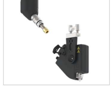
Isıtmalı hortuma entegre tutkal filtresi