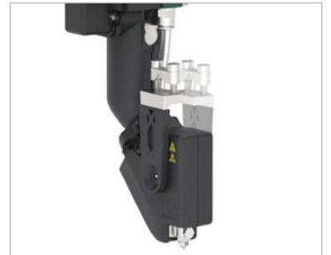
Başlık braketi sağa veya sola monte edilebilir