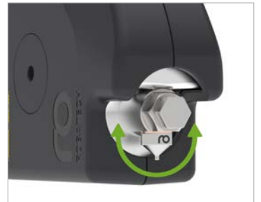
Farklı açılarda monte edilebilen uygulama nozulları