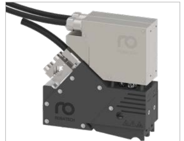
Farklı model alternatifleri