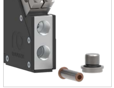
Entegre tutkal filtresi