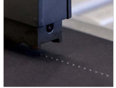
Saniyede 800 nokta