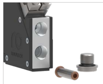
Zintegrowany filtr kleju