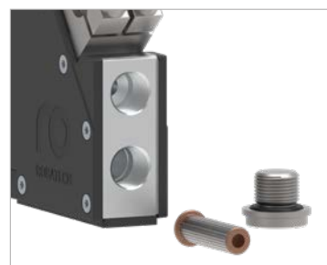
Filtre à colle intégré