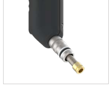
Geçmeli bağlantıya entegre filtre