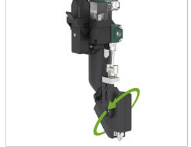
Kolay kurulum için döndürülebilir geçmeli bağlantı