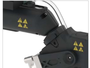
Tam yalıtımlı geçmeli bağlantı soğuk köprüleri ortadan kaldırır