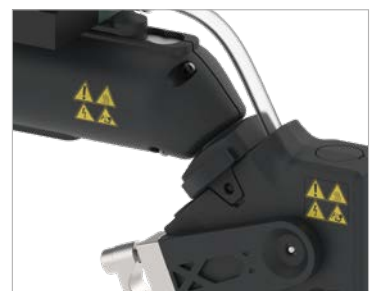
Vollisolierte Steckkupplung eliminiert Kältebrücken