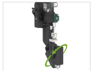
Drehbare Steckkupplung für einfachen Einbau