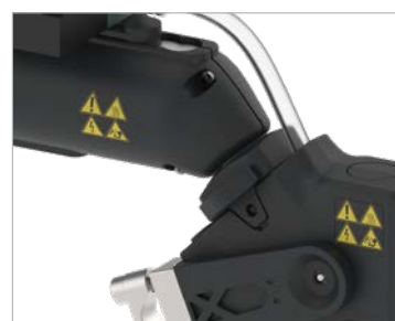
Le raccord enfichable entièrement isolé élimine les ponts thermiques