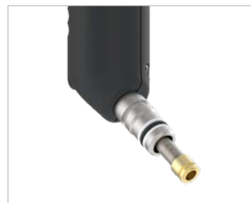
Filtre intégré dans le raccord enfichable