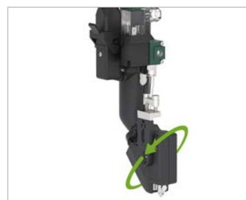
Raccord enfichable rotatif pour une installation facile