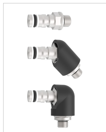
Raccords filetés 0°, 45°, 90°