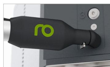
Raccord enfichable PrimeConnect