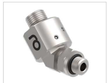
Unbeheizte Drehdurchführung 45°