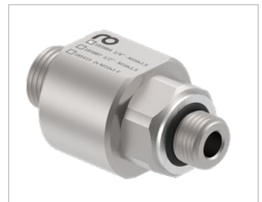
Unbeheizte Drehdurchführung gerade