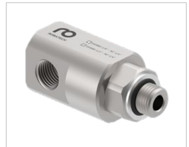
Unbeheizte Drehdurchführung 90°