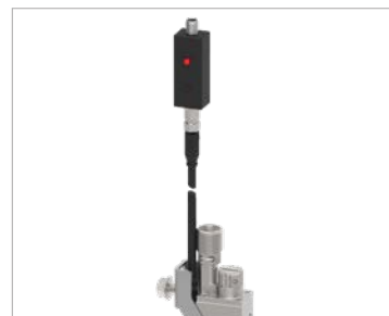
可选手动开关：便于冲洗、可快速进行功能测试