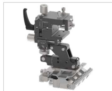
乐佰得支架：精确定位，确保精准刮涂