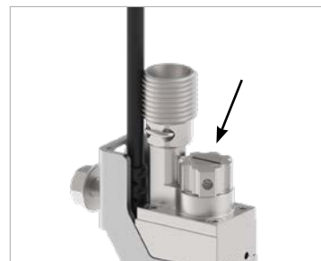
用一字螺丝刀微调胶粘剂用量