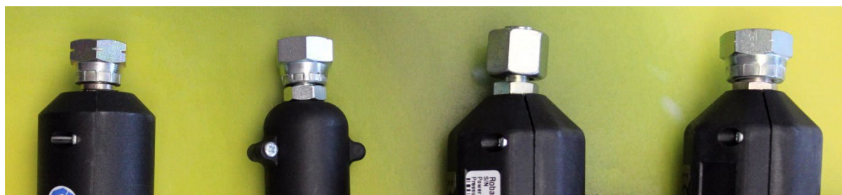
NW 8 / Typ T