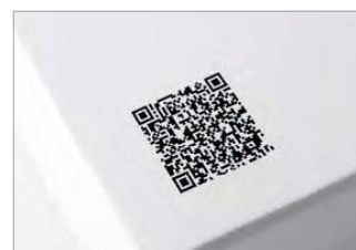
Lecture de codes 2D