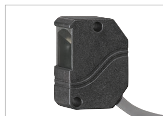
Capteur pour détection de colle thermofusible