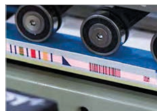
Lecteur de code-barres (1D & Pharmacode)