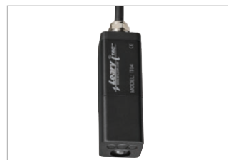
Capteur pour détection de colle froide