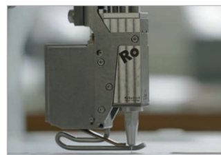
Application de colle froide