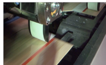
Posizionamento esatto della striscia di carta siliconata