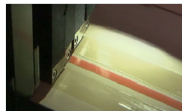
Applicazione dell'adesivo uniforme e con precisione millimetrica