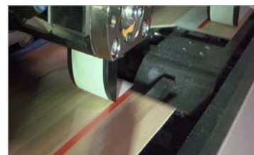
Exakte Auflage des Silikonpapierstreifens