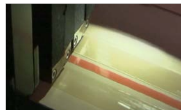
Millimetergenauer und gleichmässiger Klebstoffauftrag