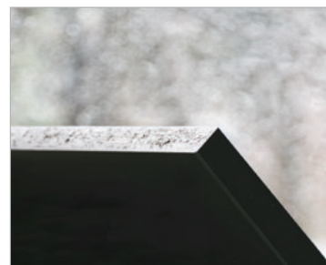
Sigillatura dei bordi