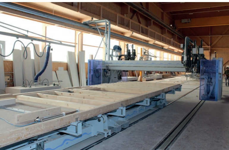
Blick auf die Gesamtanlage in der neuen Produktionshalle der Krattiger Holzbau AG in Amriswil.

Vor rund fünf Jahren wurde das alte Werk von Krattiger Holzbau zu klein. Mit dem Ziel einer Produktionserweiterung begann das Unternehmen mit der Planung eines neuen Werkes. Im Rahmen der Planung haben die Gebrüder Krattiger Multifunktionsbrücken besichtigt. «Bei einer Firma in Kaiseraugst haben wir ein 1K-PUR-Auftragssystem von Robatech auf einer Multifunktionsbrücke von Weimann im Einsatz gesehen. Wir haben zwar schon vorher Verklebungen und Pressverleimungen gemacht, aber nun entstand die konkrete Idee, in die voll automatisierte Verklebung einzusteigen. Da wir oft Hohlkastenelemente als Decken- und Dachkonstruktionen einsetzen, hat uns diese Produktlösung, die von Robatech